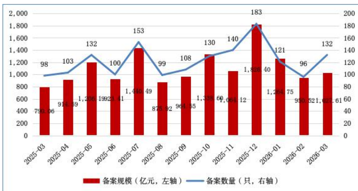
图1 ABS月度备案数量及规模情况

2026年3月，资产支持专项计划 [1] （以下简称ABS）新增备案132只，新增备案规模合计1,027.61亿元（见图1）。此外，新增备案规模前三的ABS基础资产分别为：融资租赁债权、应收账款和小额贷款债权，备案规模分别为336.85亿元、210.45亿元和182.12亿元（见表1）。