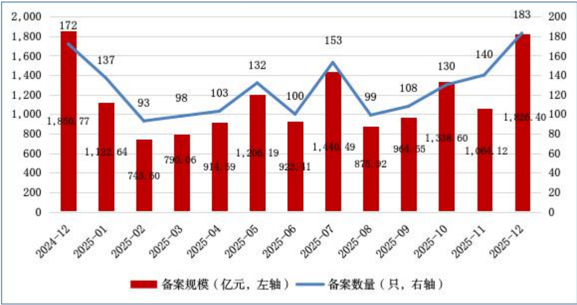
图 1 ABS 月度备案数量及规模情况

2025 年 12 月，资产支持专项计划 [1] （以下简称 ABS）新增备案 183 只，新增备案规模合计 1,826.40 亿元（见图 1）。本月不动产投资信托基金所投 ABS [2] 备案 2 只，规模为 28.74 亿元。此外，新增备案规模前三的 ABS 基础资产分别为：应收账款、融资租赁债权和小额贷款债权，备案规模分别为472.95 亿元、337.26 亿元和 319.71 亿元（见表 1）。