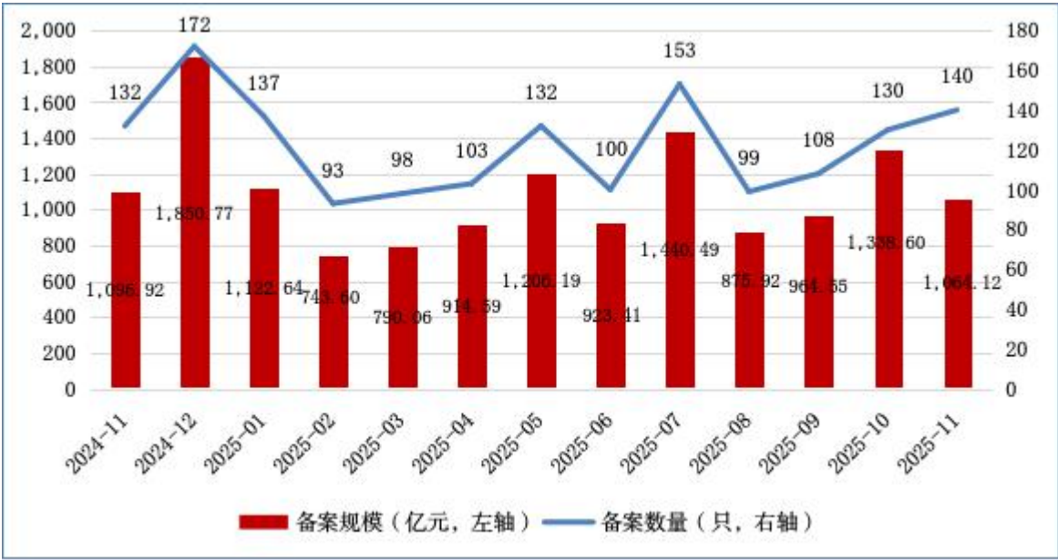
图 1 ABS 月度备案数量及规模情况

2025 年 11 月，资产支持专项计划 [1] （以下简称 ABS）新增备案 140 只，新增备案规模合计 1,064.12 亿元（见图 1）。本月无基础设施公募 REITs 所投 ABS [2] 备案。此外，新增备案规模前三的 ABS 基础资产分别为：小额贷款债权、应收账款和融资租赁债权，备案规模分别为 324.75 亿元、212.93 亿元和 187.17 亿元（见表 1）。