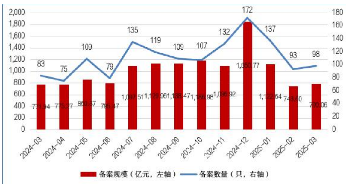
图1 ABS月度备案数量及规模情况

2025年3月，资产支持专项计划 [1] （以下简称ABS）新增备案98只，新增备案规模合计790.06亿元（见图1）。其中基础设施公募REITs所投ABS [2] 备案1只、13.62亿元。此外，新增备案规模前三的ABS基础资产分别为：小额贷款债权、融资租赁债权和应收账款，备案规模分别为235.97亿元、174.41亿元和152.78亿元（见表1）。