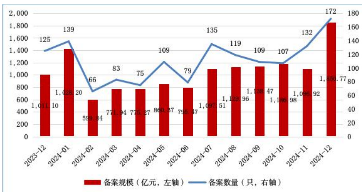
图1 ABS月度备案数量及规模情况

2024年12月，资产支持专项计划 [1] （以下简称ABS）新增备案172只，新增备案规模合计1,850.77亿元（见图1）。其中基础设施公募REITs所投ABS [2] 备案6只、134.99亿元。此外，新增备案规模前三的ABS基础资产分别为：应收账款、不动产持有型ABS、融资租赁债权，备案规模分别为514.48亿元、438.61亿元、269.02亿元（见表1）。