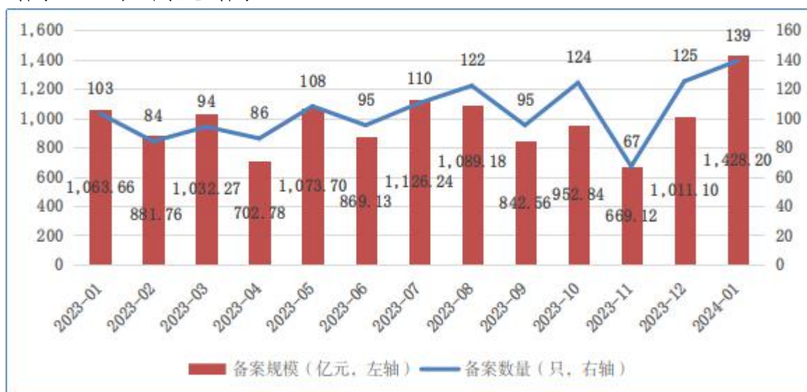
图1 ABS产品每月备案规模及数量变化趋势

2024年1月，企业资产证券化产品共备案确认139只，新增备案规模合计1,428亿元（见图1）。1月新增备案规模环比增长41%，同比增长34%。