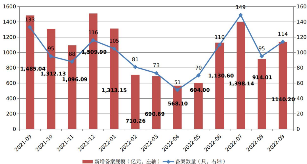
图1 ABS产品每月备案规模及数量变化趋势

2022年9月，企业资产证券化产品共备案确认114只，新增备案规模合计1,140.20亿元（见图1）。9月新增备案规模环比增长24.75%，同比减少23.22%。