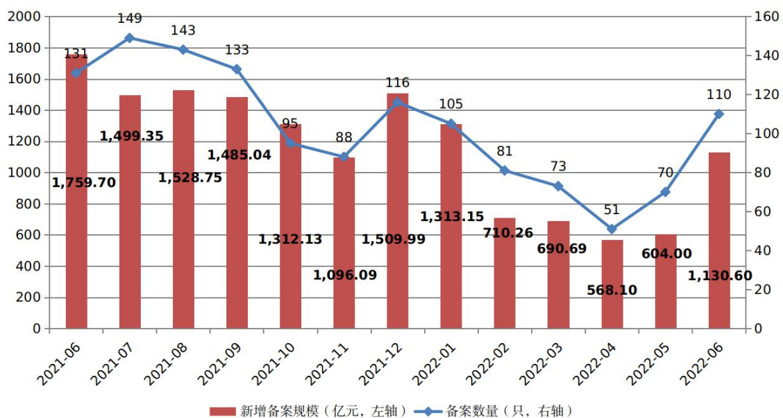
图1 ABS产品每月备案规模及数量变化趋势

2022年6月，企业资产证券化产品共备案确认110只，新增备案规模合计1,130.60亿元（见图1）。6月新增备案规模环比增加87.19%，同比减少35.75%。