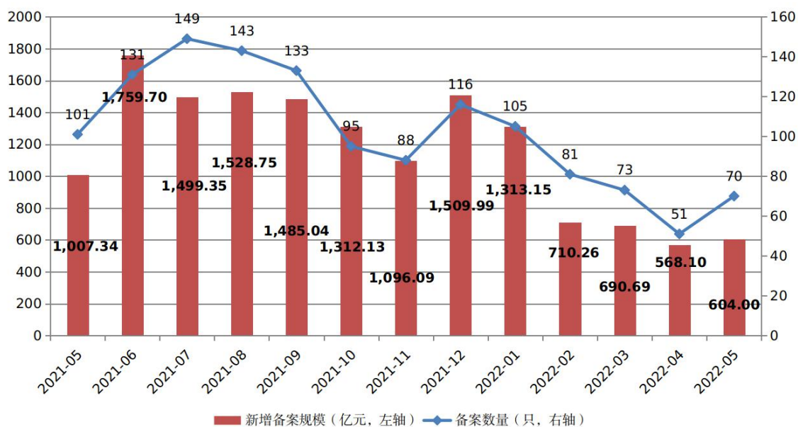
图1 ABS产品每月备案规模及数量变化趋势

2022年5月，企业资产证券化产品共备案确认70只，新增备案规模合计604.00亿元（见图1）。5月新增备案规模环比增加6.32%，同比减少40.04%。