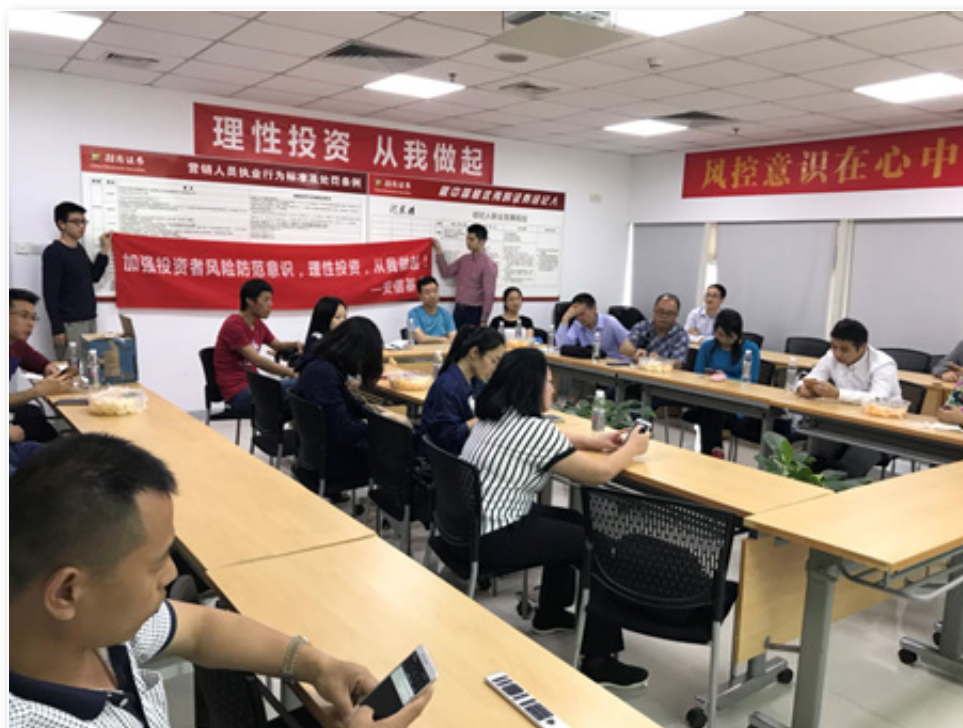
2018年4月, 安信基金在招商证券开展投资者教育培训活动。