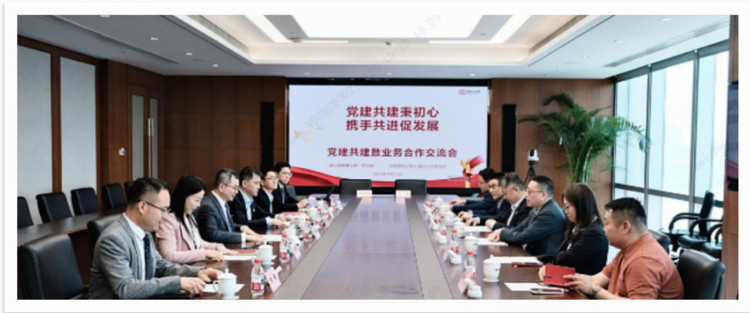
图 2：党建共建暨业务合作交流会

举办“以漆为媒，共绘清廉”党建联建参观活动，将廉洁教育融入文化体验；携手国投瑞银资本子公司党支部共同参观中国共产党历史展览馆，强化集团内部党建联动。同时，与广发证券上海分公司党支部以“重温历史忆往昔，携手奋进新征程”为主题开展党建共建和业务交流活动，实现党建与业务交流的同频共振。