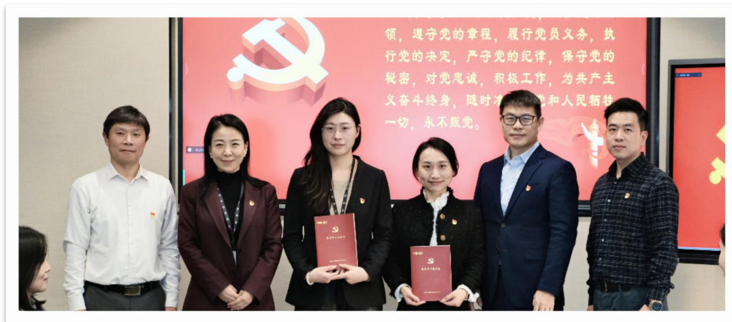
图 3：预备党员入党宣誓仪式

在组织运行与活动统筹方面，形成“党总支统筹、支部落实、内外联动”的工作格局：执委会决策中充分体现党建与业务融合要求；党总支听取稽核审计部、财务部、法律合规部和人力资源部相关工作汇报，对公司业务发展、法律合规和风险管理等企业重要事项进行专项研究；在组织开展年度党务知识竞赛、年度轮训活动、各地支部志愿者活动、主题党课等党建活动时，发挥党建引领作用，带动群团和青年员工，鼓励公司全体员工参与；通过前往红色教育基地，采取“集中培训+现场教学”方式，邀请党员和群众参加，让广大党员和群众了解党的历史，加强党性修养、团队建设和企业文化建设，充分调动和激发全体员工干事创业的积极性和创造性。