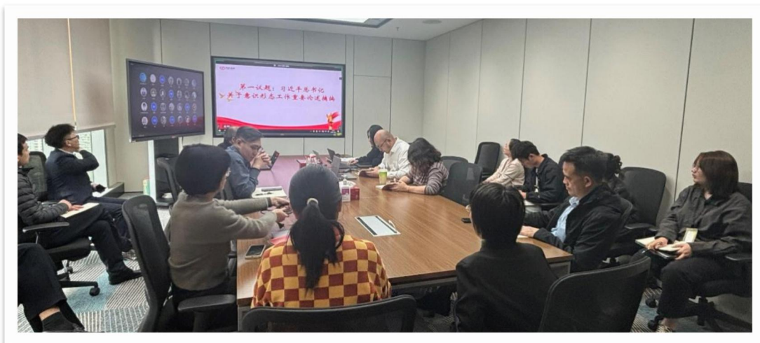
图 1：开展“第一议题”学习

2025 年，党总支创新学习形式，组织开展专题研讨，引导党员干部将学习成果转化为服务实体经济的实践动能。在 2025 年的学习规划中，党总支将深入学习党的二十届四中全会精神作为重要任务。依据全会精神指引，围绕三大核心方向展开深度学习与实践转化：一是提高政治站位，深刻领会党的二十届四中全会的重大历史与现实意义；二是聚焦核心要义，准确把握“十五五”时期金融工作的方向与任务；三是立足主责主业，将全会精神转化为推动公司高质量发展的生动实践。此外，为深化作风建设学习，组织党员学习《习近平总书记关于加强党的作风建设论述摘编》相关章节，让党员深刻领会作风建设关乎党的形象、人心向背和生死存亡，确保公司发展始终与党中央保持高度一致。