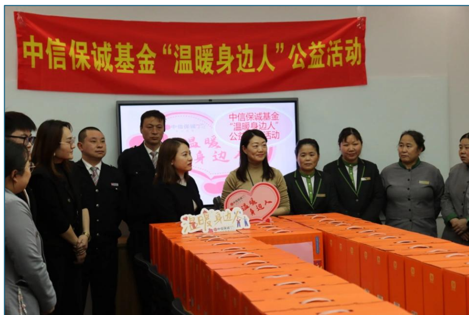
2024年新春佳节，为办公楼保安保洁送上“爱心礼包”。

三是服务社会。 2023年，公司自主设立、帮扶外来务工人员子女健康成长的“宝藏小屋”项目，再次被中国基金报评为“英华奖·最佳公益实践案例”。2024年新春佳节响应上海基金同业公会“温暖身边人”号召，为浦东新区基层单位的值班工人送上“暖心餐”，为公司办公大楼的保安保洁送上“爱心礼包”，用真情驱寒意，以行动暖人心。