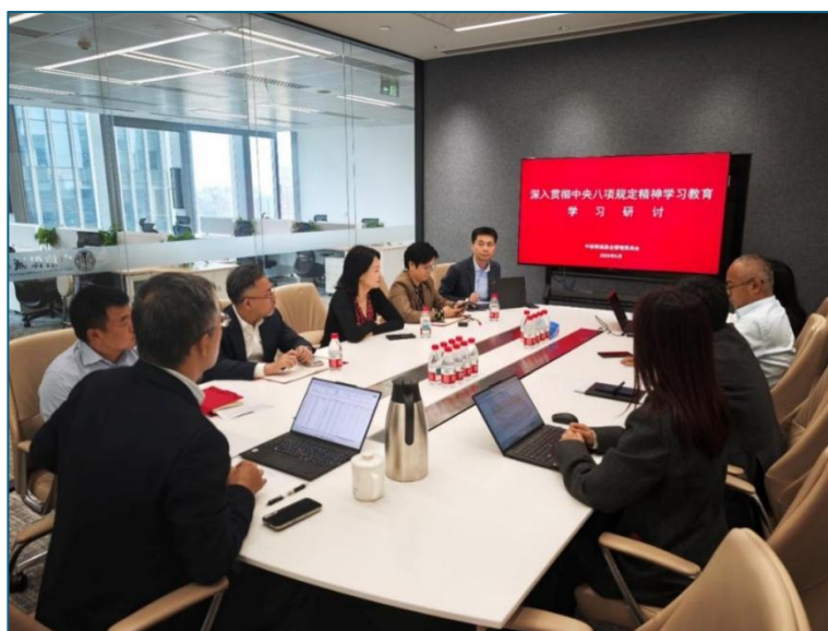
2025年5月，中信保诚基金经营班子带头开展深入贯彻中央八项规定精神学习教育。

公司成立二十年来，在积累优势的同时，也出现了如何成功开启“第二增长曲线”的瓶颈性问题、如何从根本上提升队伍效能的深层次问题。“党建+队伍”不仅需在提高员工积极性上发力，更要激发迎难而上、改革进取的主人翁精神。公司党总支和经营班子结合实际发出了“勇于自我革命，奋力二次创业”的号召，从三方面谋求突破。